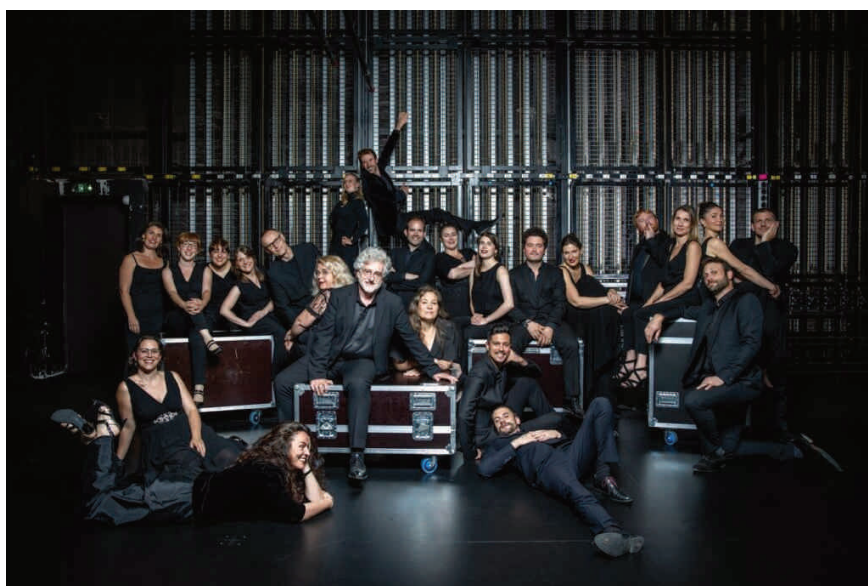
Le Chœur de chambre Mélisme(s)