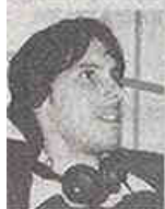
PHILIPPE DE WECK COMPOSITEUR ET CONCEPTEUR DES «HORLOGES»